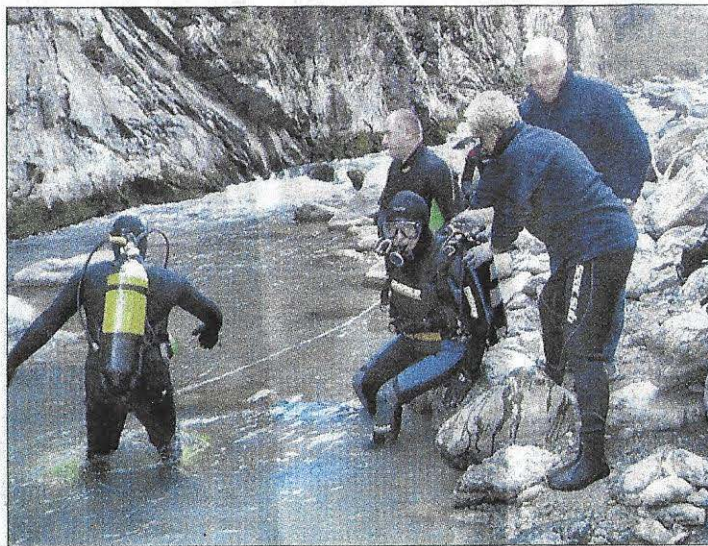
I preparativi prima dell'immersione con simulazione di ricerca