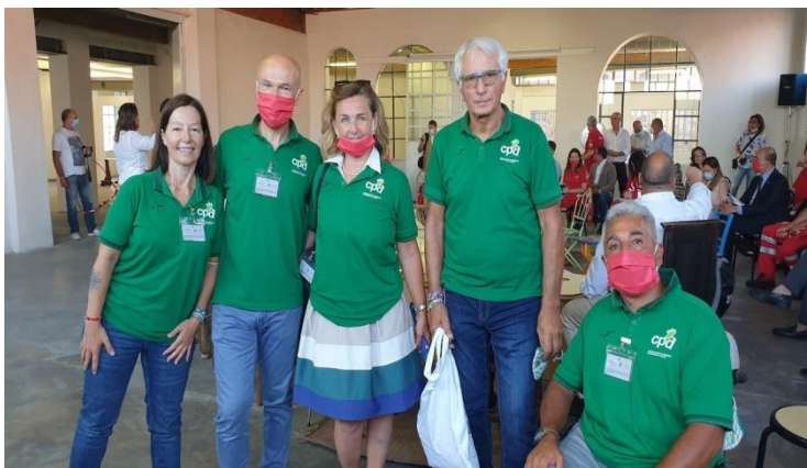
Con Associazione Inchiostro