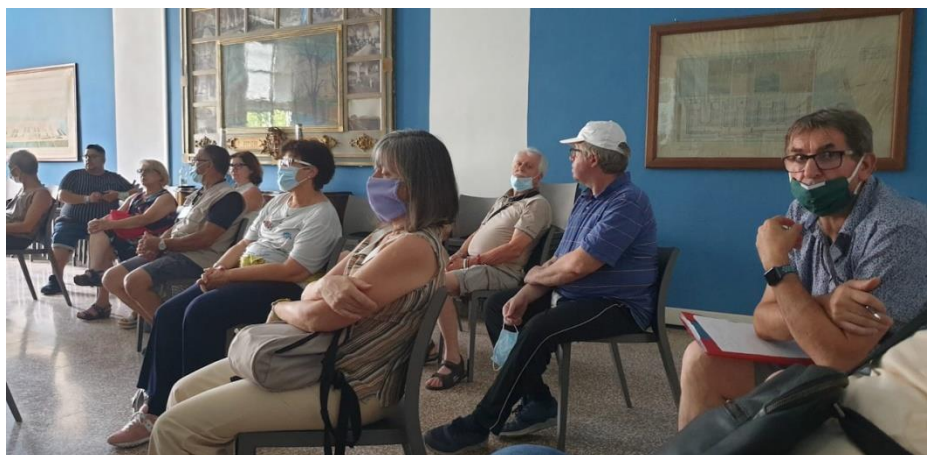
Alcuni dei Volontari presenti

Martedì 30 giugno , abbiamo partecipato ad una interessante presentazione per conoscere più approfonditamente la C.P.D. e le molteplici attività svolte al servizio della Solidarietà da parte della Consulta delle Persone in Difficoltà. Inoltre, nel corso dell'incontro sono state date alcune informazioni operative sul "Progetto Paniere" predisposto dal Comune di Torino nell'ambito delle iniziative di Torino Solidale .