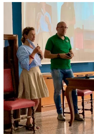
L'intervento della nostra Presidente