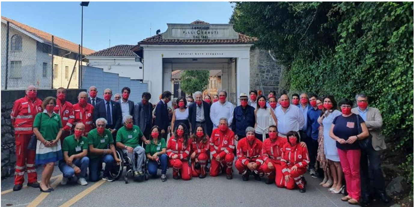
La cerimonia del 20 Luglio a Biella