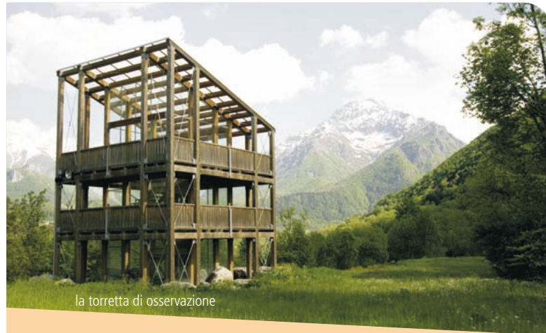
la torretta di osservazione

Dal contatto con tutti questi personaggi emerge una morale solo in apparenza scontata: il lupo non è né buono né cattivo, il lupo attacca altri animali perché così vuole il suo istinto, perché quella è la parte che gli è stata assegnata nella grande rappresentazione del ciclo della vita.