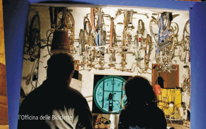
l'Officina delle Biciclette