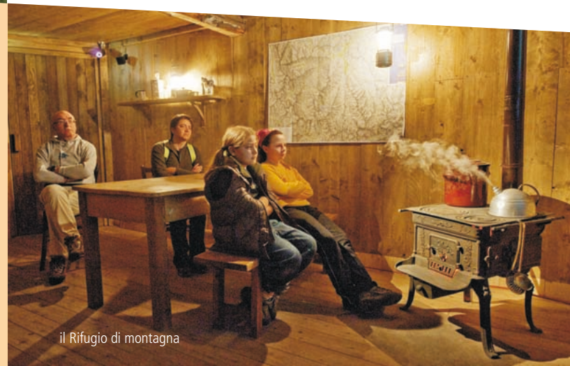
il Rifugio di montagna

Alla torretta si giunge attraverso un tunnel al cui interno si snoda un percorso di visita che presenta il lupo dal punto di vista naturalistico. Insieme al recinto e al tunnel in località Casermette , posizionati presso la sede operativa del Parco delle Alpi Marittime, il Centro faunistico Uomini e Lupi comprende un secondo spazio espositivo nel paese di Entracque , dedicato al rapporto uomo-lupo.