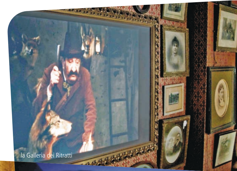
la Galleria dei Ritratti