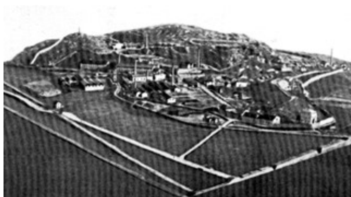
PLASTICO DELLO STABILIMENTO VALLOJA NEGLI ANNI '30