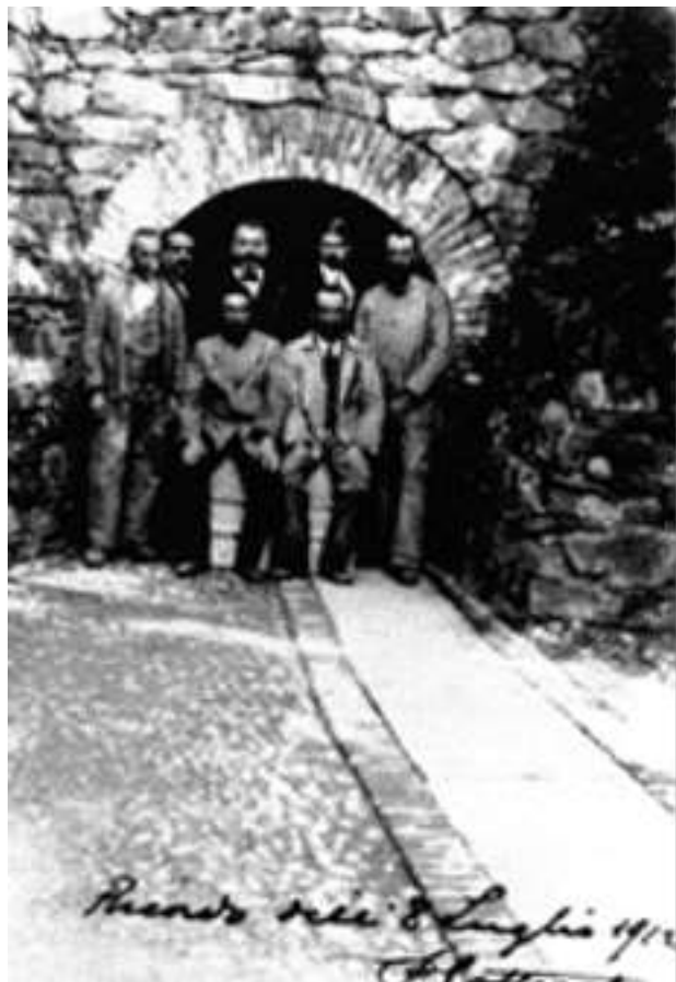
LAVORATORI DAVANTI AD UN CUNICOLO DI ACCESSO AL REPARTO NITRAZIONE NEL 1912