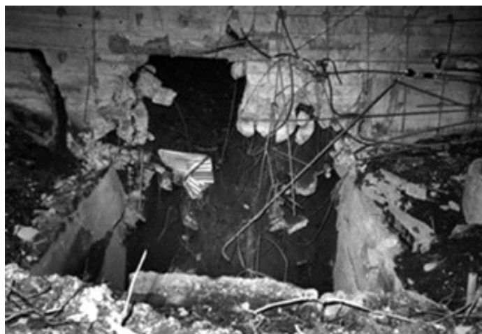
DOPO L'ESPLOSIONE DEL 16 GENNAIO 1900